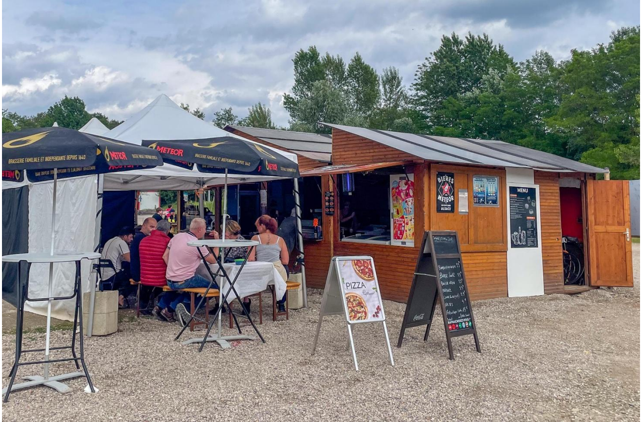
Sur place : le snack de la gravière du fort

Pendant la belle saison, traiteur sur place.