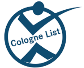
Liste de Cologne (ALL)