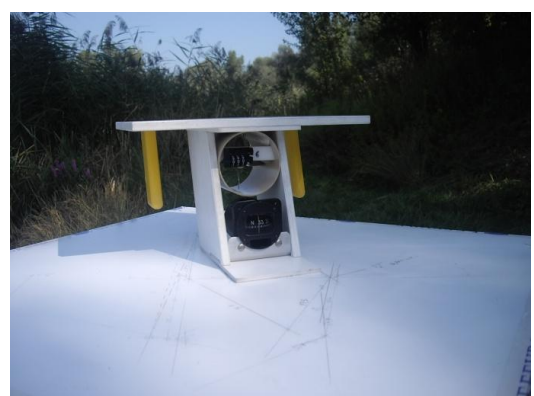
Exemple planchette de navigation