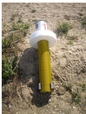
Exemple Bouée repère